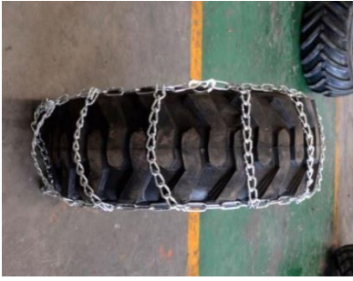
Schneeketten Tyre Chain